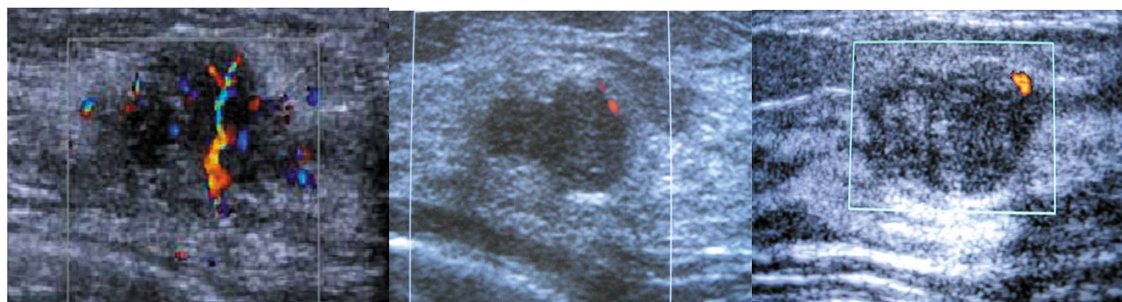
图 4 >10 分非三阴性乳腺癌